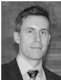
AUTOR: MAG. GREGOR BINDER, MSC MIM

Das neue Formular dient der Erweiterung der Möglichkeiten zur Abrechnung von Reisekosten für SportlerInnen, SchiedsrichterInnen und SportbetreuerInnen für den Fall, dass die Reisekosten das steuerfreie und sozialversicherungsfreie Ausmaß der SportlerInnenbegünstigung übersteigen. Somit stehen derzeit drei unter-